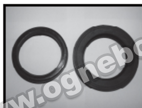
Тип А Тип Б Рис. 7